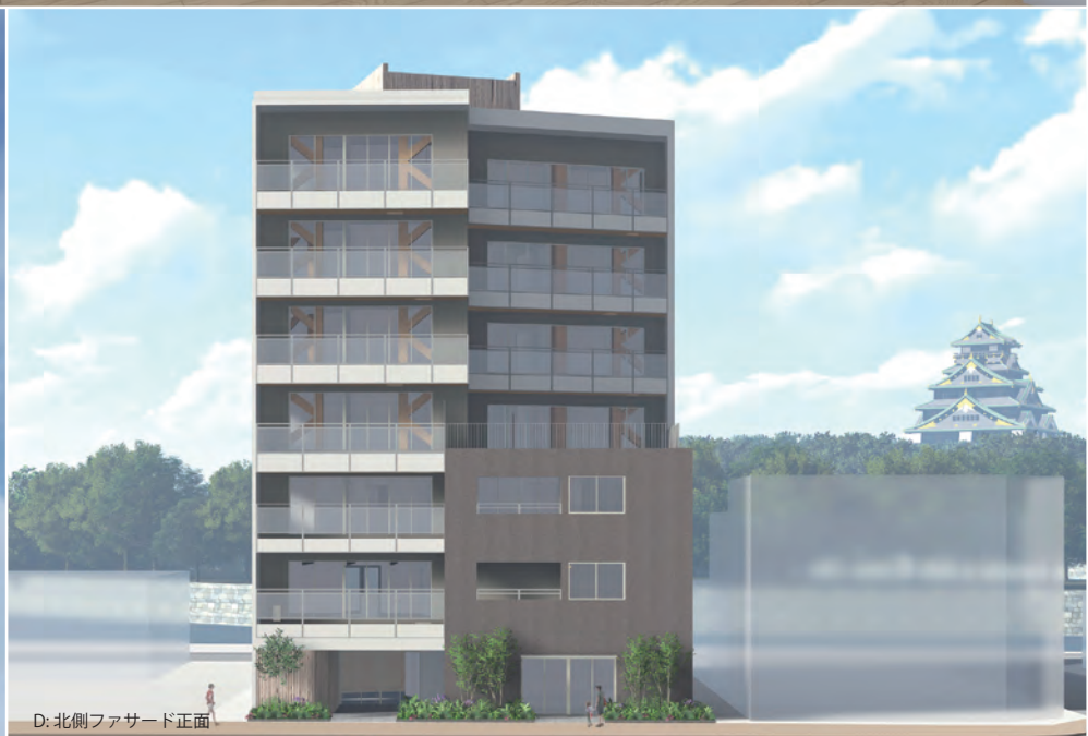
D: 北側ファサード正面