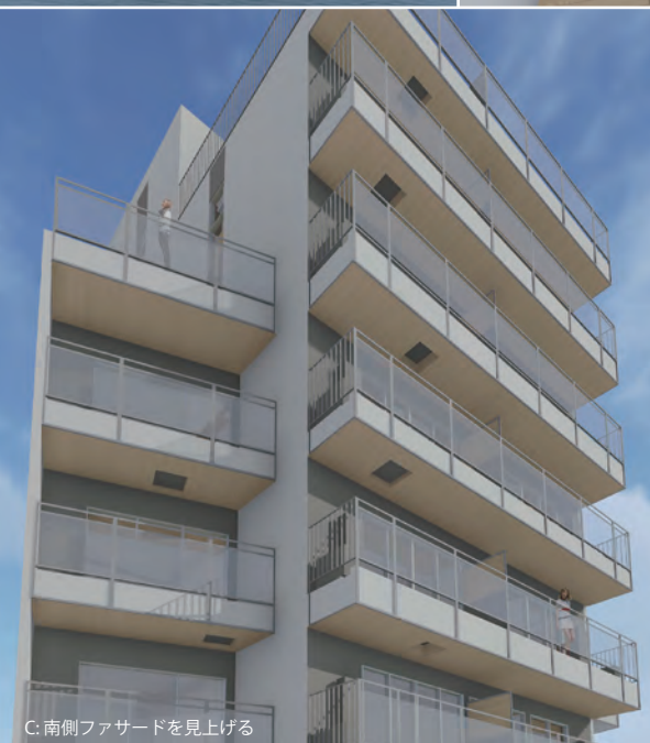
C: 南側ファサードを見上げる